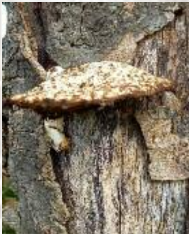
Zadelzwam: ( Polyporus squamosus )

Geniet even mee van de zelf gefotografeerde paddenstoelen!