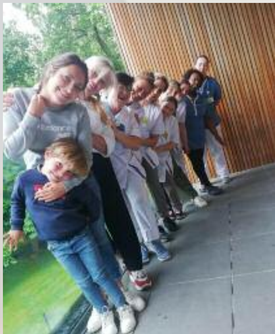
Vorbereidingen maken voor de komende activiteit.