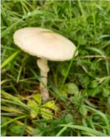
Blanke champignonparasol: ( Leucoagaricus leucothites )

Paddenstoelen van deze soort leven van afbraak van dood plantaardig materiaal. En leven slechts enkele dagen.