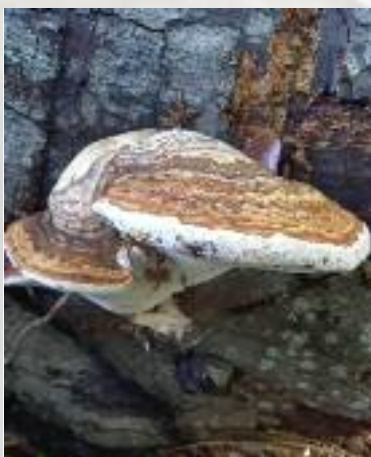
Echte tonderzwam: ( Fomes fomentarius )

Meestal in parken en bomenrijen op voedselrijke, vochtige bodem.