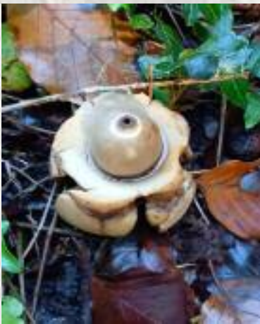
Gekraagde aardster: ( Geastrum triplex )

Paddenstoelen van deze soort leven van afbraak van dood plantaardig materiaal. En leven slechts enkele dagen.